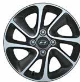
14" 8-ramienna alumiuniowa obręcz (metaliczny szary)