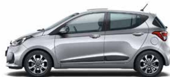
Sleek Silver (RYS - Metaliczny)