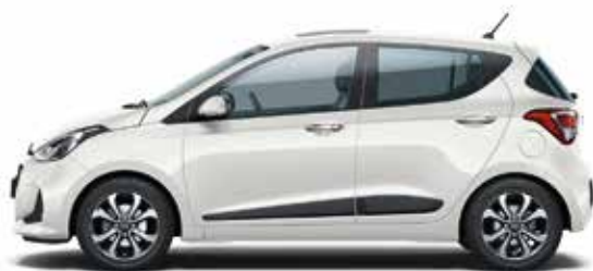
Polar White (PSW - bez dopłaty)

Dobierz kolor, koła i wykończenie wnętrza aby Twój nowy Hyundai i10 był idealny.