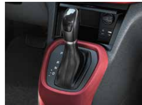
4-biegowa automatyczna skrzynia biegów. Płynnie przełączający się automat pomaga pozbyć się stresu związanego z jazdą zakorkowanymi ulicami miasta.