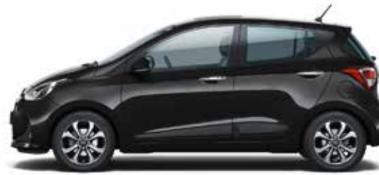
Phantom Black (X5B - Perłowy)