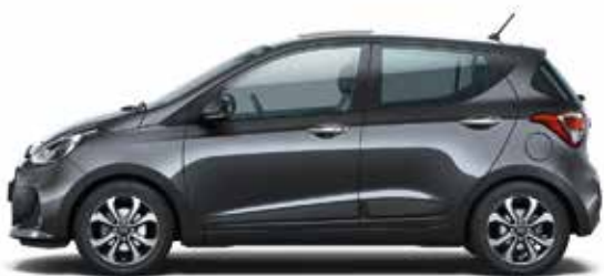
Star Dust (V3G - Metaliczny)