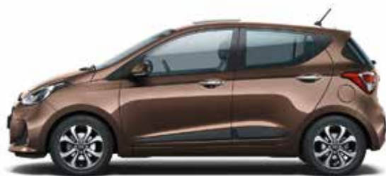
Cashmere Brown (X9N - Metaliczny)