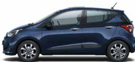
Morning Blue (X3U - bez dopłaty)