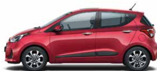
Passion Red (X2R - Perłowy)