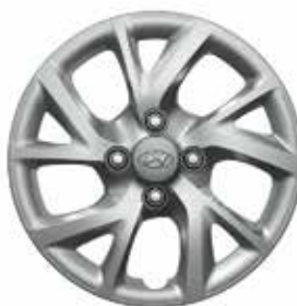
14" 10-ramienny kołpak (metaliczny szary)