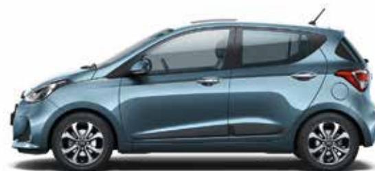
Aqua Sparkling (W3U - Metaliczny)