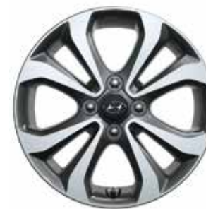
15" 8-ramienna alumiuniowa obręcz (metaliczny szary)