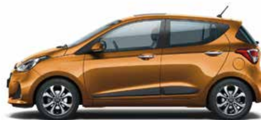
Mandarin Orange (T5A - Perłowy)