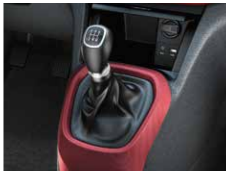
5-biegowa manualna skrzynia biegów. Precyzyjna przekładnia gwarantuje dodatkową przyjemność z jazdy, szczególnie podczas jazdy poza terenem zabudowanym.

Udoskonalone silniki oraz skrzynie biegów zapewniają osiągi, o których marzysz. Dodatkowo wiąże się to z mniejszym zużyciem paliwa i niższą emisją spalin. Możesz wybrać spośród trzech jednostek napędowych: 3-cylindrowy silnik benzynowy 1.0 o mocy 66 KM, 4-cylindrowy silnik 1.25 o mocy 87 KM lub wersja 1.0 LPG o mocy 67 KM. Silniki idealnie współgrają z 5-biegową skrzynią manualną lub 4-biegowym automatem. Dodatkowo wyżej umiejscowiony drążek zmiany biegów jest wygodny i łatwy w obsłudze.