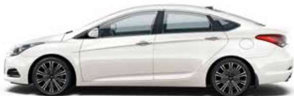
White Crystal (PW6 - PERŁOWY)