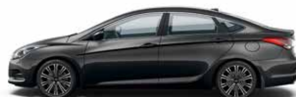
Phantom Black (NKA - PERŁOWY)