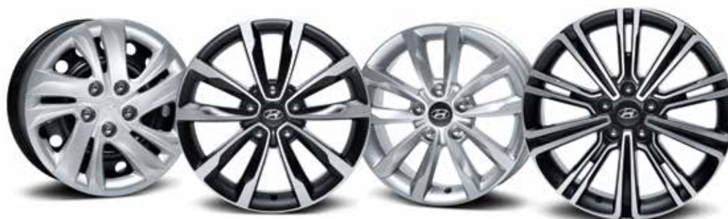
Felgi stalowe + kołpaki 16"