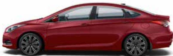
Red Merlot (VR6 - PERŁOWY)