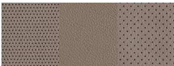
Beżowa skóra (naturalna + syntetyczna)