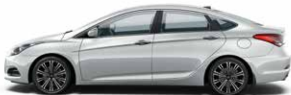
Platinum Silver (T8T - METALIK)