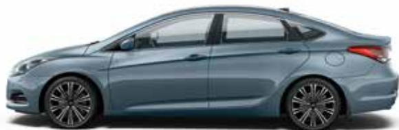
Mineral Blue (VU2 - METALIK)