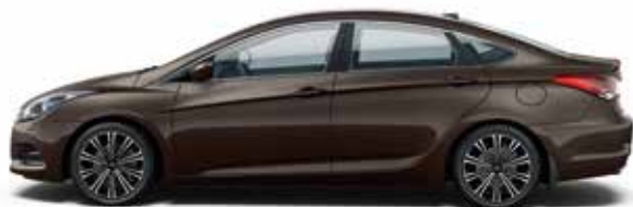
Tan Brown (YN7 - PERŁOWY)