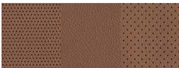
Brązowa skóra (naturalna + syntetyczna)