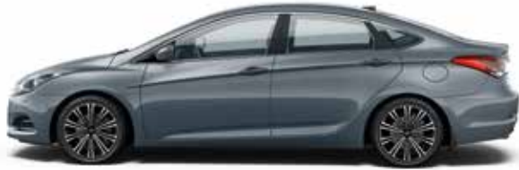
Titanium Silver (T6S - METALIK)