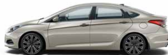
Chalk Beige (VY2 - METALIK)