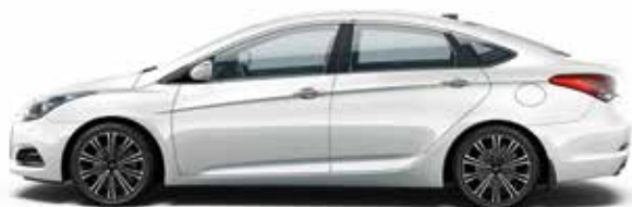
Pure White (PKW - SOLID)

Najbliższy dealer Hyundai doradzi Ci i pomoże dokonać najlepszego wyboru.