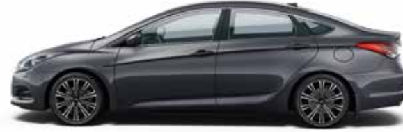
Stone Grey (S6G - METALIK)