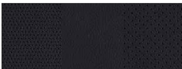
Czarna skóra (naturalna + syntetyczna)