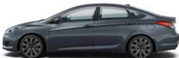
Ocean View (W8U - METALIK)