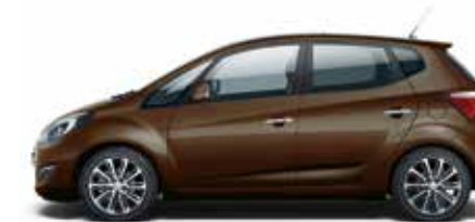
Demitasse Brown (RB4 – Perłowy)