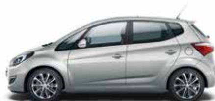
Platinum Silver (U3S – Metalik)