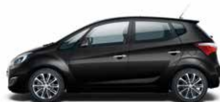
Phantom Black (PAE – Perłowy)