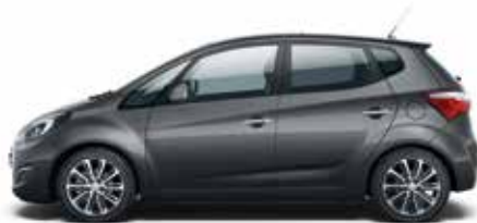
Micron Grey (Z3G – Perłowy)