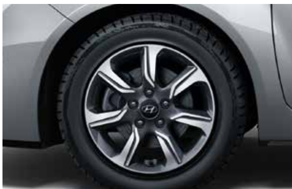
Felgi aluminiowe 16"