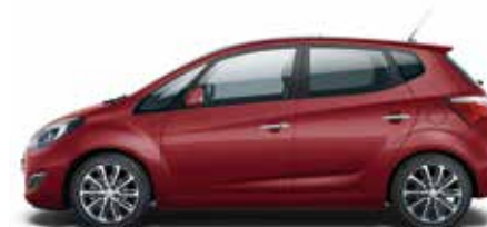
Fiery Red (PR2 – Metalik)