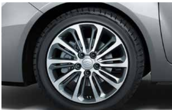
Felgi aluminiowe 17"