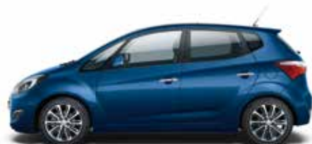
Stargazing Blue (SG5 – Perłowy)