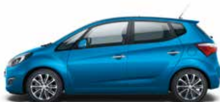
Ara Blue (R3U – Metalik)