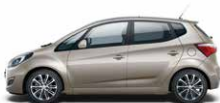
White Sand (Y3Y – Metalik)