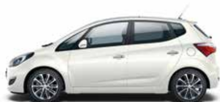
Polar White (PYW)

Najbliższy Autoryzowany Dealer Hyundai doradzi Ci i pomoże dokonać najlepszego wyboru.