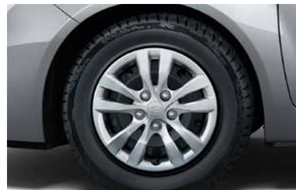
Felgi stalowe 15"